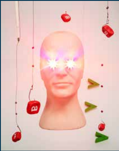
Max Dauven, Assuming Control, 2021